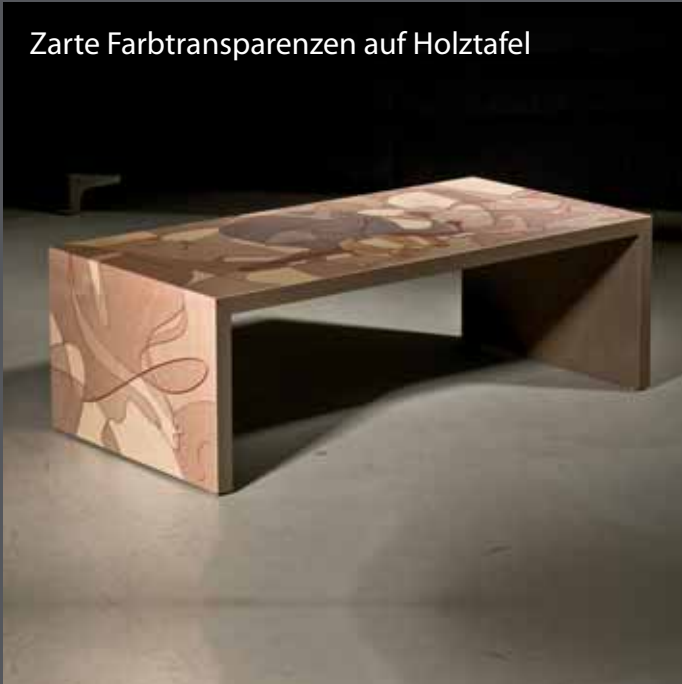
Zarte Farbtransparenzen auf Holztafel