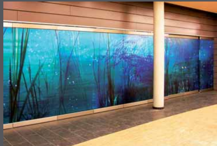
Druck auf Sicherheitsglas