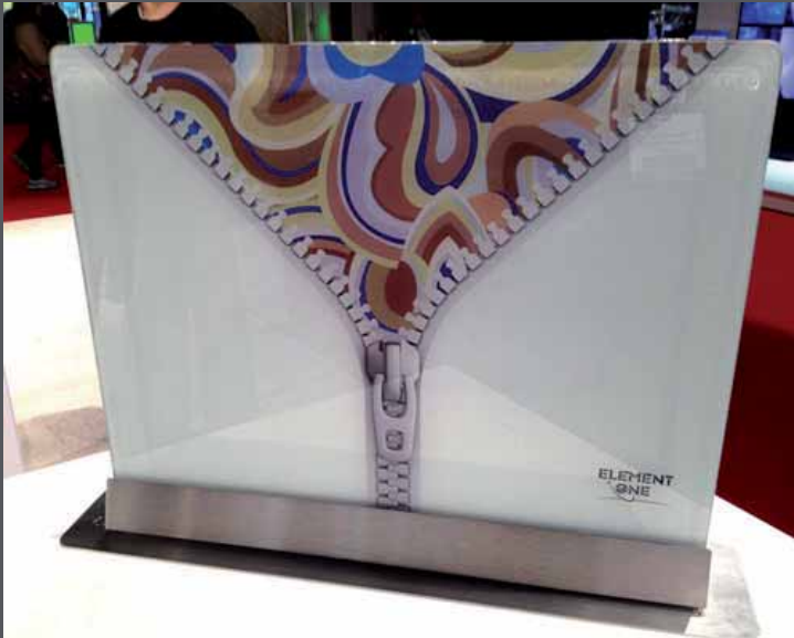
Hinter-Glas-Druck mit weißer Hinterlegung