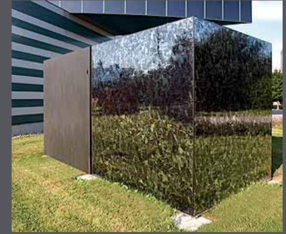
Druck auf Spiegel-Glas