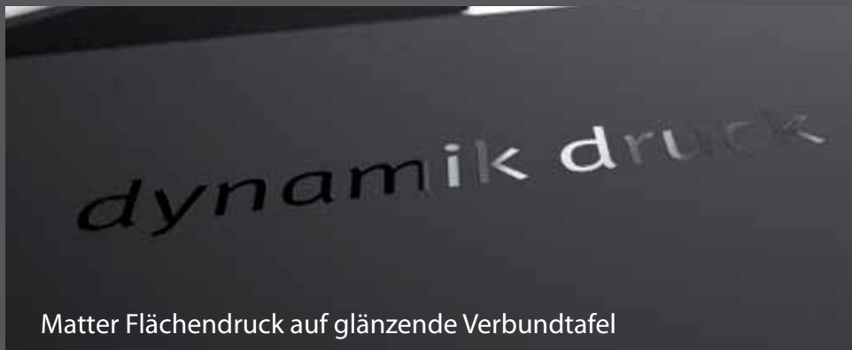
Matter Flächendruck auf glänzende Verbundtafel