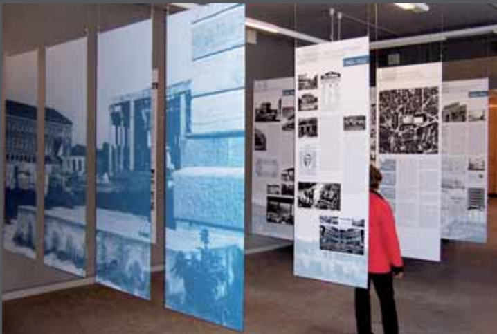
Veranstaltungs- und Ausstellungsflächen