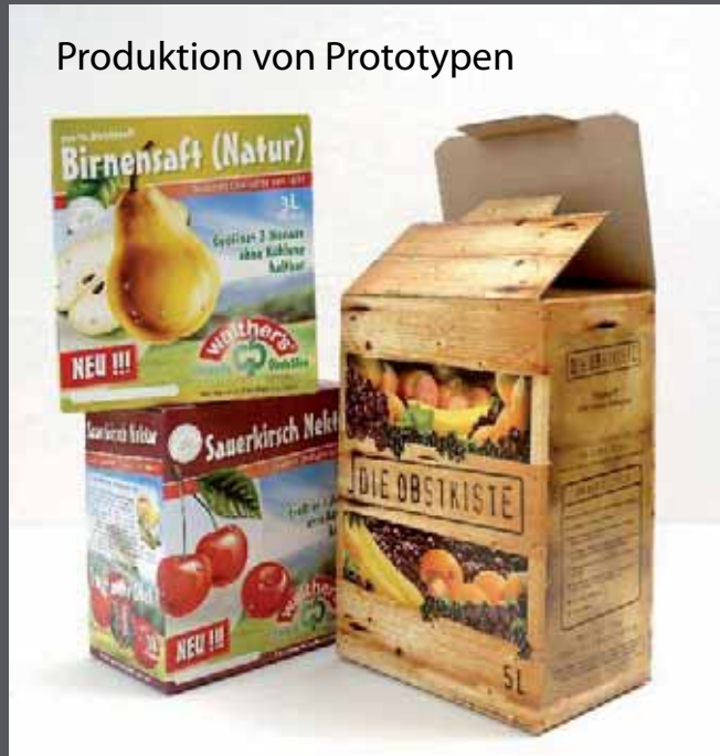
Produktion von Prototypen